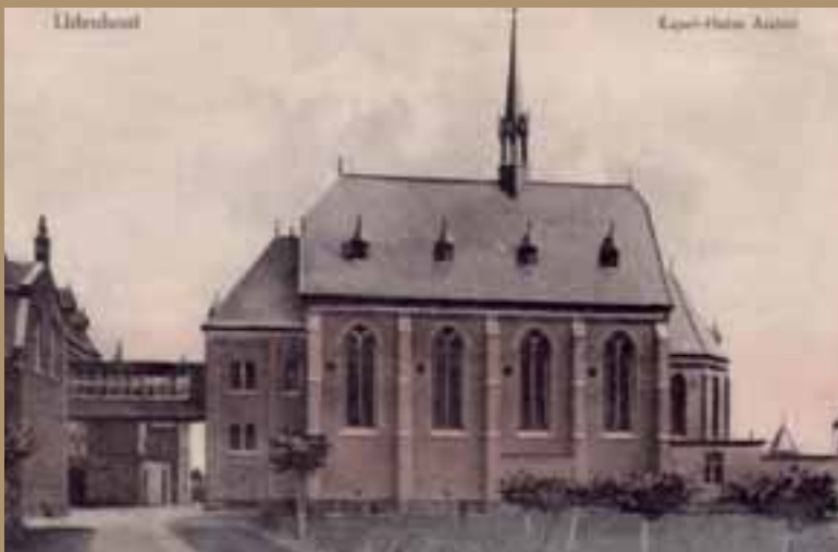
1910, De kapel van Franciscus van Assisië. De verbinding tussen kapel en hoofdgebouw werd de 'tram' genoemd.

na te bootsen. Zelfs mensen uit de omgeving waren enthousiast en kwamen er bij bidden. Maar de geestdrift was niet onverdeeld. Toen de grot werd ingezegend waren er ook die er niets voor voelden om naar die 'puisten' te gaan.