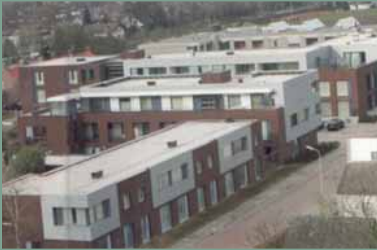
Wooncentrum dr. Maassen: Modern wonen en leven.