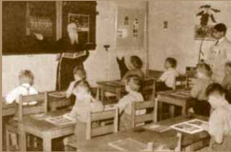
Pater Rector geeft catechismus op school.