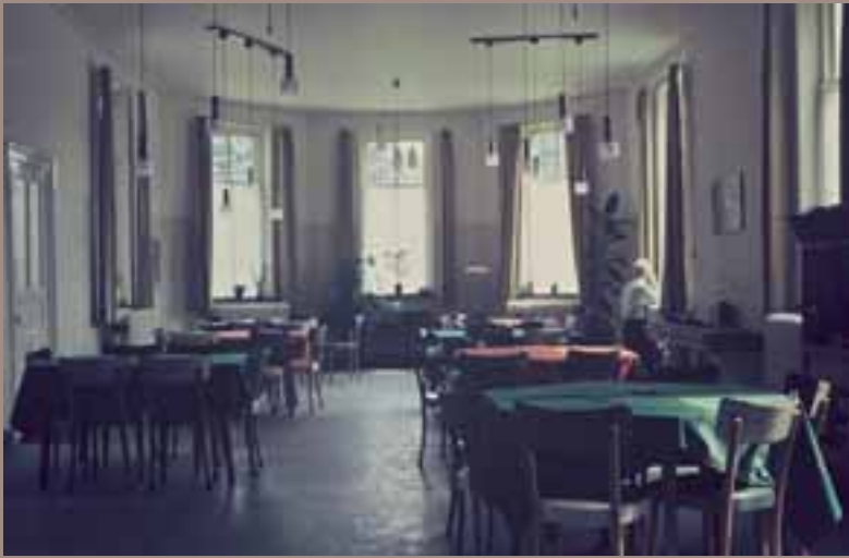
1974, 'Zeskantje' Maria 5