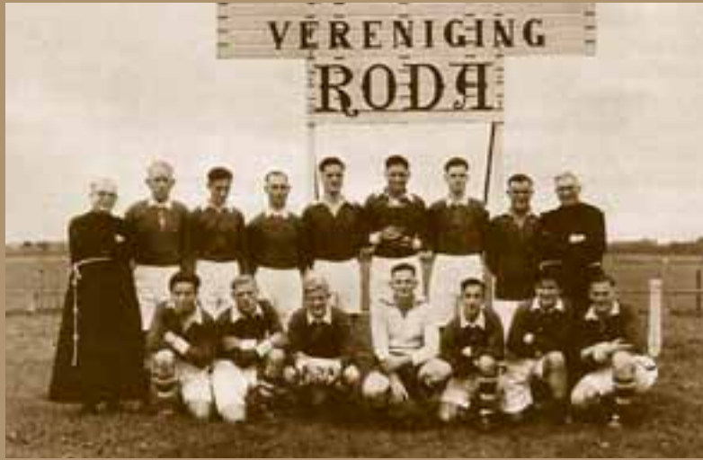
In 1922 had Assisië zijn eerste elftal en voetbalveld. De naam van de voetbalclub is nogal eens veranderd. Allereerst TOP (Tot Ons Plezier). Dit werd EMM (Eendracht Maakt Macht). In 1951 werd het RODA (Recht Op Doel Af). Er werd in competitie gespeeld met andere inrichtingselftallen uit Brabant.