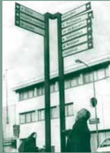
Leven in de lokale samenleving. Een cliënt temidden van de vertokkingen die het gewone leven biedt.