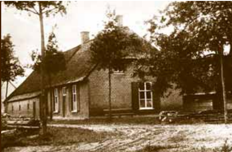
Een van de drie boerderijen uit de tijd vóór Assisië.

Assisië kent vele verhalen. Verhalen die vertellen van de mensen die er soms tientallen jaren leefden en werkten. Verhalen van de familie en bekenden die bij hen op bezoek kwamen.