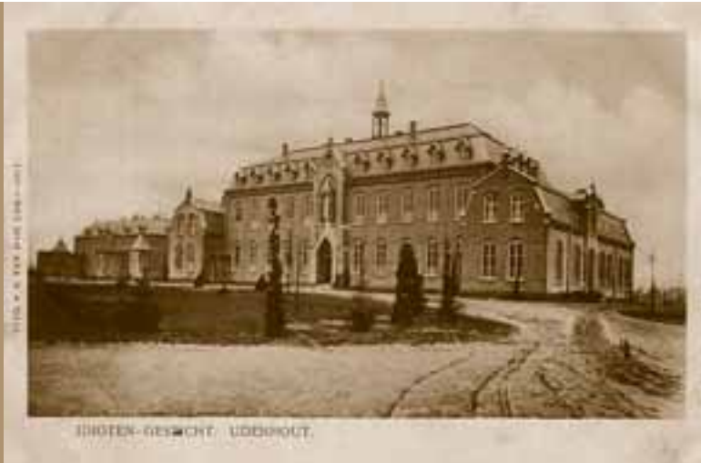
1909, Maria paviljoen.

Broeder Fidelus, werkzaam in de schilkamer, over de ontstaansperiode van Assisië: "Op dinsdag 12 januari 1904 vertrokken we met 20 patiënten en 5 broeders vanuit Huize Padua in Boekel naar Udenhout. Op een wagen met drie paarden bespannen, zaten we als haringen in een ton. Onderweg hadden we heel wat belangstelling. Via Erp en Veghel kwamen we in Den Bosch aan, waar de paarden door een vers span werden vervangen. De laatste kilometers gingen vlug, maar toen we bij de laan kwamen, hadden we pech. Omdat het dooide was de laan één modderpoel geworden, waar de wielen van de kar tot de assen inzakten. Het duurde nog een half uur voor we bij het hoofdgebouw waren en we hadden er al 7 uren opzitten."