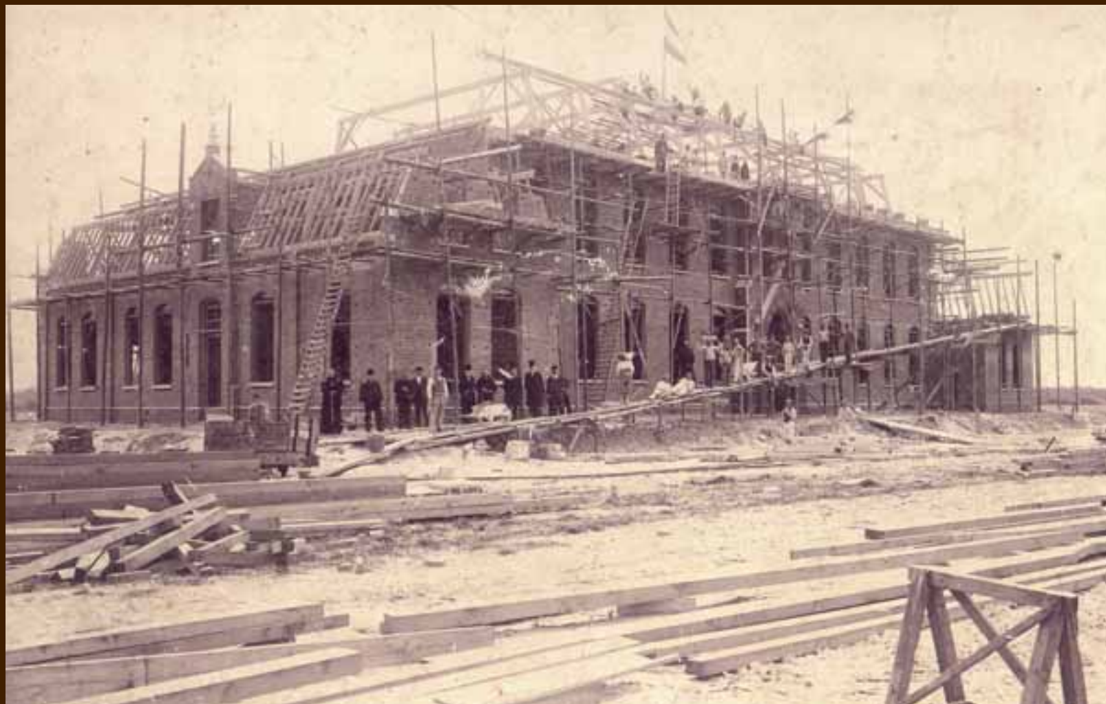
1903 het hoofdgebouw in de steigers