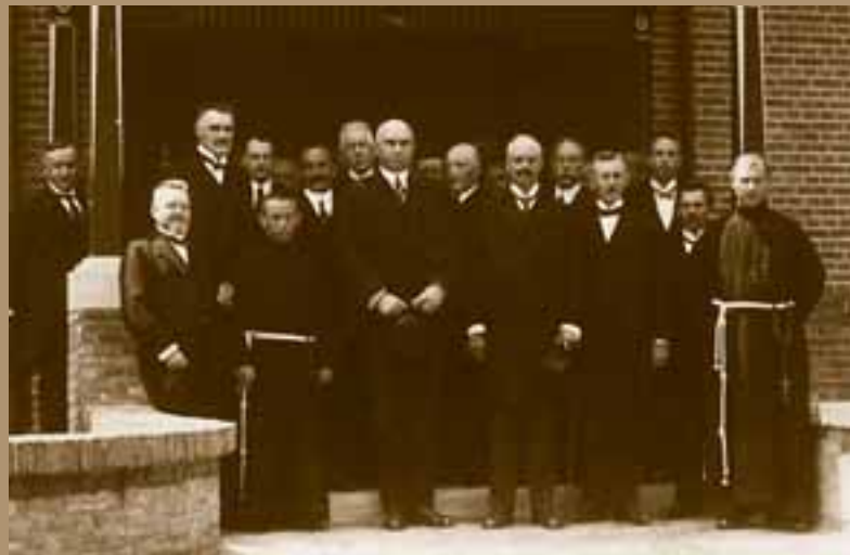
Autoriteiten en genodigden Bij gelegenheid der plechtige opening van ziekenpaviljoen en nieuw schoolgebouw, op 21 juni 1924 door Z.Exc. jhr. mr. Ch. Ruijs de Beerenbrouck, Minister-President. De heren staan voor het schoolgebouw, geen dame te zien.

In 1922 besluiten de broeders het anders aan te pakken. Door bevoegde leerkrachten van buiten de orde aan te nemen krijgt de school erkenning van de staat met de bijbehorende subsidie. De broeders gaan weer in de verpleging. Op 1 juni 1922 is de officiële start van de eerste R.K. school voor BLO (Bijzonder Lager Onderwijs) in Nederland, verbonden aan een inrichting. In 1924 is het nieuwe schoolgebouw klaar. Voor het onderwijs worden leermiddelen gebruikt van de broeders van Liefde uit Gent. De onderwijzers gaan regelmatig naar Gent om nieuwe kennis op te doen. De leerlingen krijgen de gewone schoolvakken, voor zover dat "nodig en mogelijk te onderwijzen" is. Verder is er "nuttige arbeid, die alleen reeds als bezigheid van de allergrootste betekenis is". Verder wordt er gezongen, gelezen, gesport en gespeeld zoals op elke andere school.