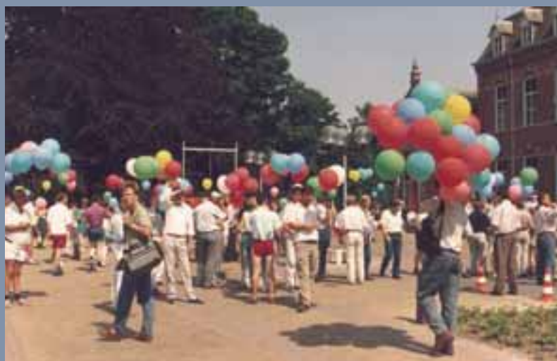
1989, festiviteiten voor het 85-jarig bestaan.

Uit mijn dagboek, 17 januari 1982. Eindelijk: ik krijg een eigen kamer! Ze gaan de grote paviljoens slopen en ik word bewoner van een kamer van mezelf. Assisië gaat op een vakantiedorp lijken. Met kleine huisjes, een manege, restaurant, café, toneelzaal, voetbalveld en een kinderboerderij. Alle bedrijven verdwijnen, behalve de keuken en de wasserij.