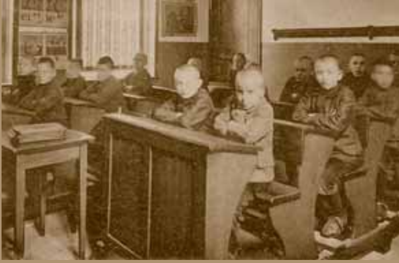
Een klas in 1922.