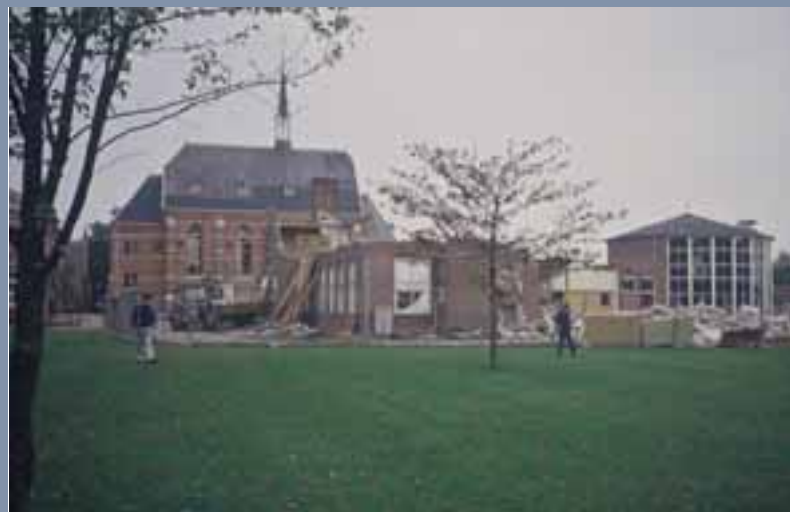
1990, sloop Jozef paviljoen. Helaas sneuvelt de koepel ook.