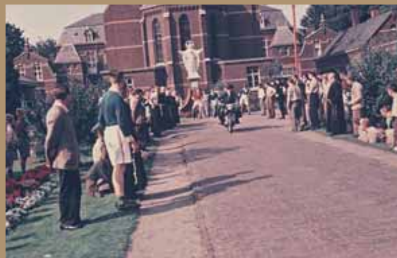
1958, lange tijd werden er jaarlijks wielervedstrijden gehouden.