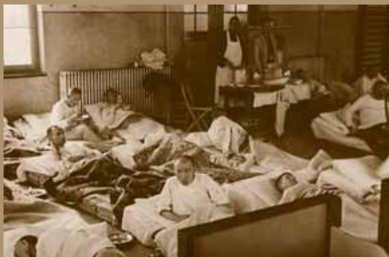
Evacué's uit Boekel Tweemaal werden patiënten van Huize Padua tijdens de oorlog opgevangen in Assisië. Voor de 250 patiënten moesten in allerijl de school,