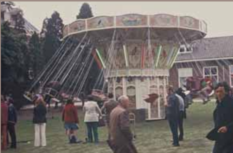
De jaarlijkse kermis Tot de mooiste momenten in de inrichting horen de gezamenlijke feesten met bewoners, medewerkers en ouders. Ze geven een ritme aan het jaar. In deze feesten komt het idee van leefgemeenschap zijn duidelijk naar voren.

Het was allemaal even wennen na 60 jaar. De plaats van de broeders die met een groot hart dagelijks voor ons hadden gezorgd, werd door anderen, met ingewikkelde opleidingen, ingenomen. Ik zag steeds meer mensen met mappen over het terrein lopen. Ze gingen dan vergaderen, zeiden ze. Ze schreven van alles in mijn dossier. Maar ze vroegen nog steeds niet aan mij wat er in moest staan.