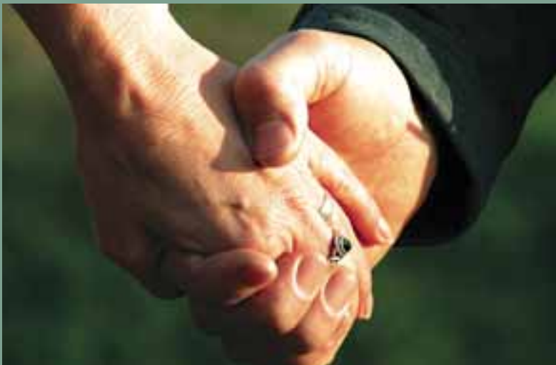
Seksualiteit betekent ook intimiteit.