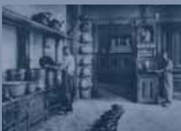
De keuken in de loop van 90 jaar Tot 1978 bevond de keuken zich in het hoofgebouw. In dat jaar - toen men nog volop geloofde in de toekomst van de inrichting - werd er op het terrein een nieuwe keuken gebouwd. De capaciteit was 800 maaltijden per dag. In 1997 werd de keuken gesloten. Vanaf die tijd worden de maaltijden betrokken uit de keuken van Amarant (ontkoppeld koken).