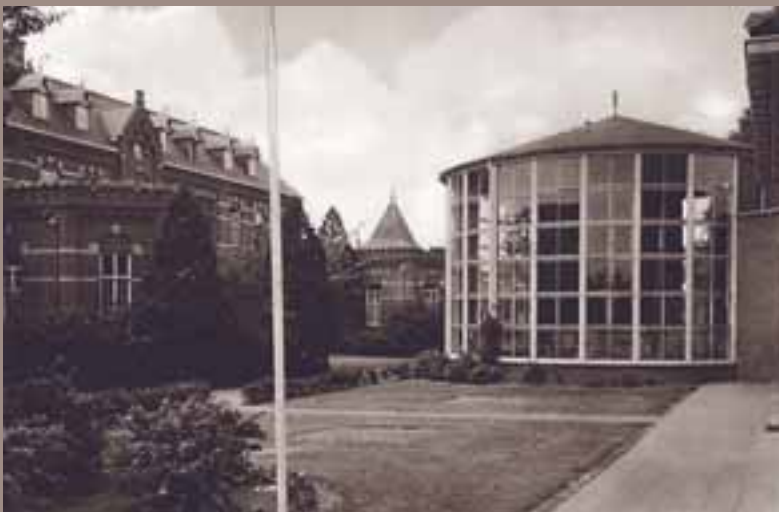
De befaamde Koepel (wintertuin) van het Jozefpaviljoen. Qua arbeidsomstandigheden niet ideaal, het kon er bloedheet zijn.