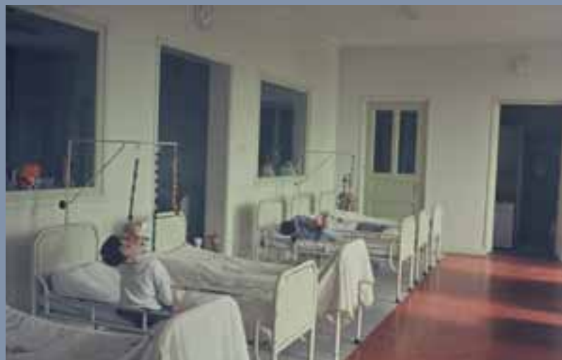
In de jaren tachtig komt er spelmateriaal op de bedzalen.