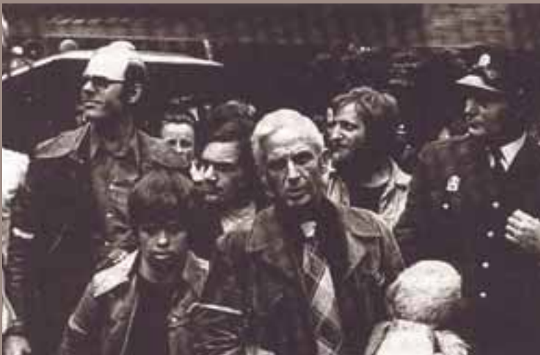
De kerk en de zwakzinnigenzorg zijn de laatste plaatsen, waar ik politie zou willen zien." Dat zei staatssecretaris Hendriks op 19 januari 1974 in een Brandpunt-uitzending. Op 3 juli werd paviljoen Lorentz van Dennendal met behulp van meer dan 100 man politie ontruimd, met toestemming van Hendriks.