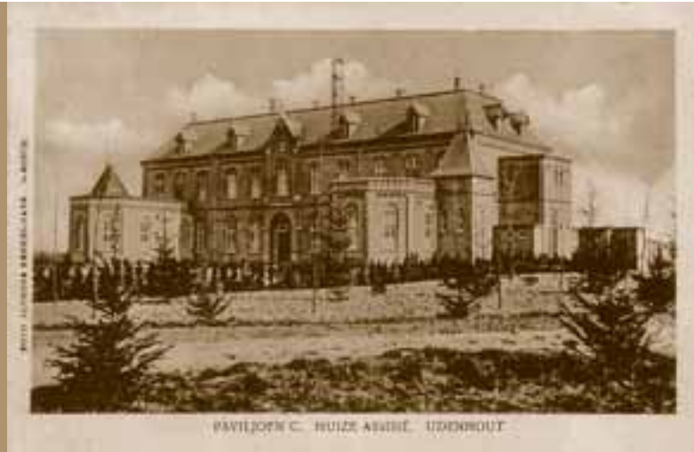
1904, het hoofdgebouw.