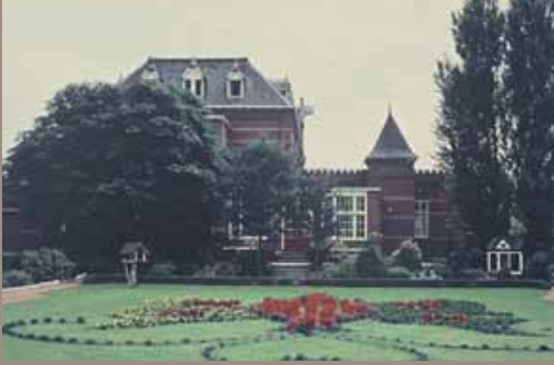
1970, tuin Maria 5.