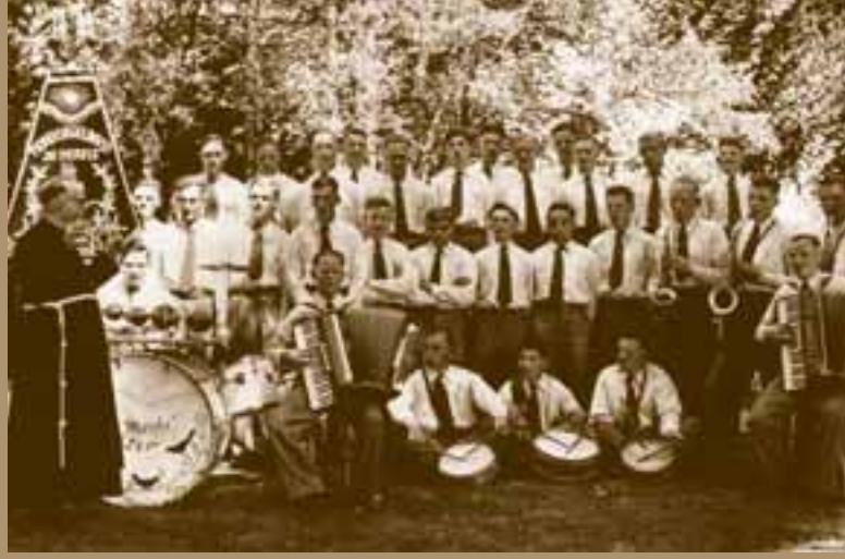
Mondorgelband 'De Merels' Oppericht in 1928 en voortdurend uitgebreid. Er was geen feest in huis zonder de club. Ze speelden ook buiten de instelling. In 1947 werd de band omgevormd tot fanfare.