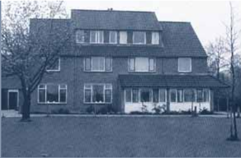
Stop buitenplaatsingen Deze in december 1987 gereed gekomen sociowoning aan de rand van het terrein vormde het compromis tussen de voorstanders van buitenplaatsingen, de groepsleiding en het paviljoen-begeleidingsteam en anderzijds de

groot naar klein, van massaal naar intiem, van zaal naar eigen slaapkamer! Het was huiselijk en we kregen meer persoonlijke aandacht. Dat was een ongekende luxe."