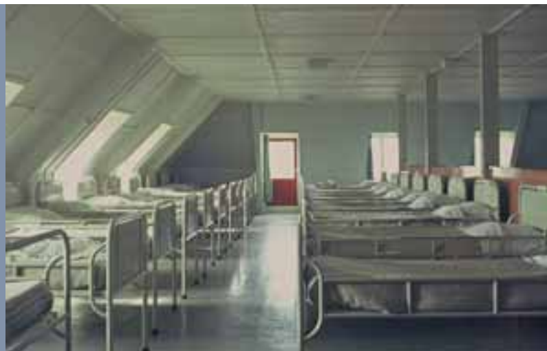
Tot 1983 Slaapzaal Antonius voor 50 bewoners. De oude gebouwen waren absoluut niet meer toereikend om aan de veranderende zorgvragen tegemoet te komen. Ze waren te klein en er was geen enkele privacy. Bewoners sliepen

ontwikkelen, kleinschaligheid, regionalisatie, integratie