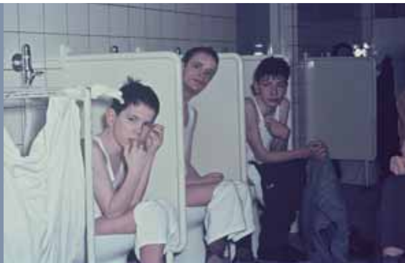
1970, toiletgroep Jozef 2. Grote groepen en weinig personeel resulteerden in groepsbenadering: allemaal tegelijk wassen, naar de w.c., eten, wandelen, op uitstapje.

in grote zalen en overdag was er maar één ruimte die diende als eetzaal, zithoek en televisiekamer. De bewoners zaten de hele dag op elkaars lip, wat vaak tot spanningen leidde.