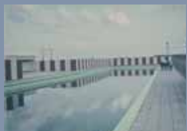
Van zwembad tot manege in vier bedrijven.

De medewerkers van Assisië hebben gezegd dat de medewerkers van Assisië in een brief aan de bond van Assisië gezegd worden.