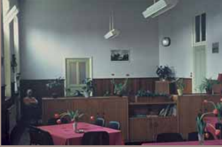
1973, dagzaal Fransiscuspaviljoen.