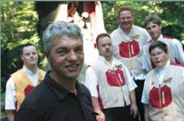
De wonderse wereld van het werken bij de Efteling.