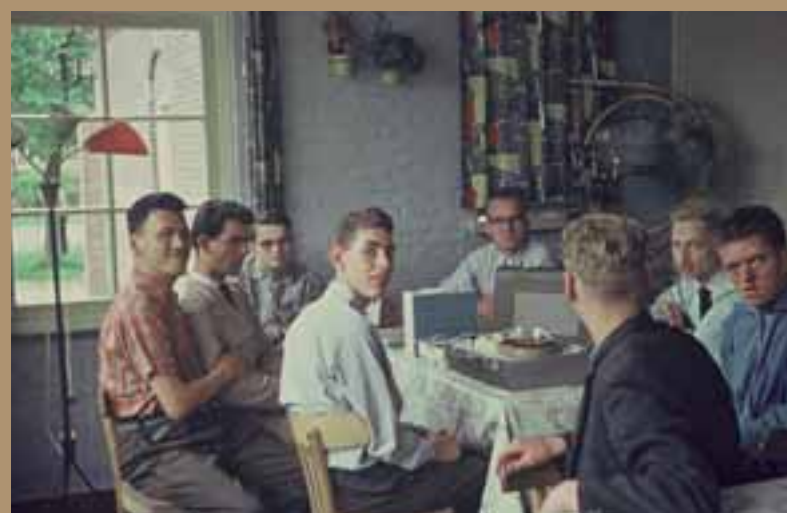
± 1960, hobbyruimte bij Pauluspaviljoen.