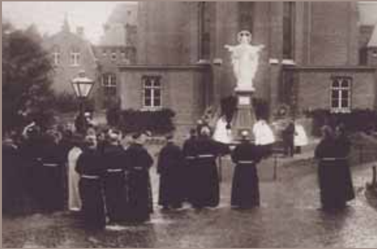
De broeders Penitenten: dienende liefde in franciscaanse eenvoud. Een bijzondere congregatie die zich vanaf 1832 bezig hield met de verpleging van psychiatrische patiënten en verstandelijk gehandicapten.