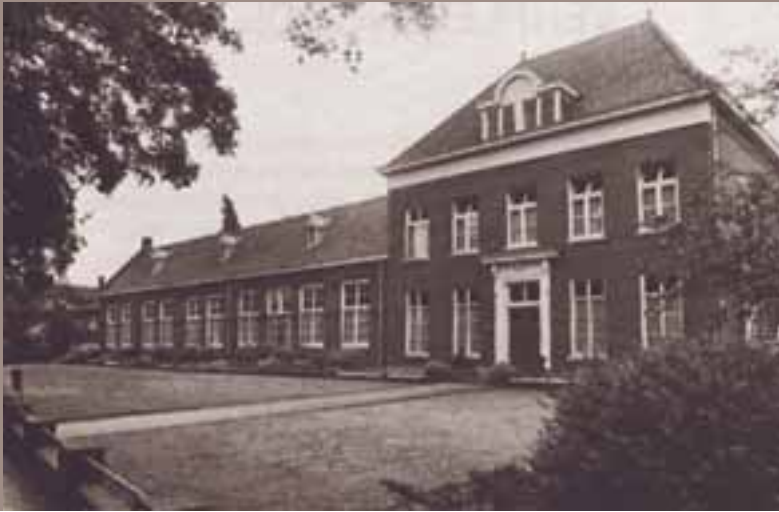
Het in 1975 in gebruik genomen internaatsvervangend tehuis 'Inverte' in Loon op Zand. Later werd elders nieuw gebouwd. Thans in gebruik als openbare bibliotheek.

Het verschil tussen het leven in Assisië en dat erbuiten, werd wel erg groot. Niemand woonde in 1980 nog op een zaal met 25 anderen. Zonder kaste voor je spullen. Nou, wij wel! Wij hadden veel meer regels dan de mensen buiten de inrichting. De vrijheid die ik om me heen zag, was er niet voor mij.