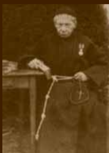
Vader Lucas, tweede stichter van de Congregatie. Besloot tot oprichting van Assisië.